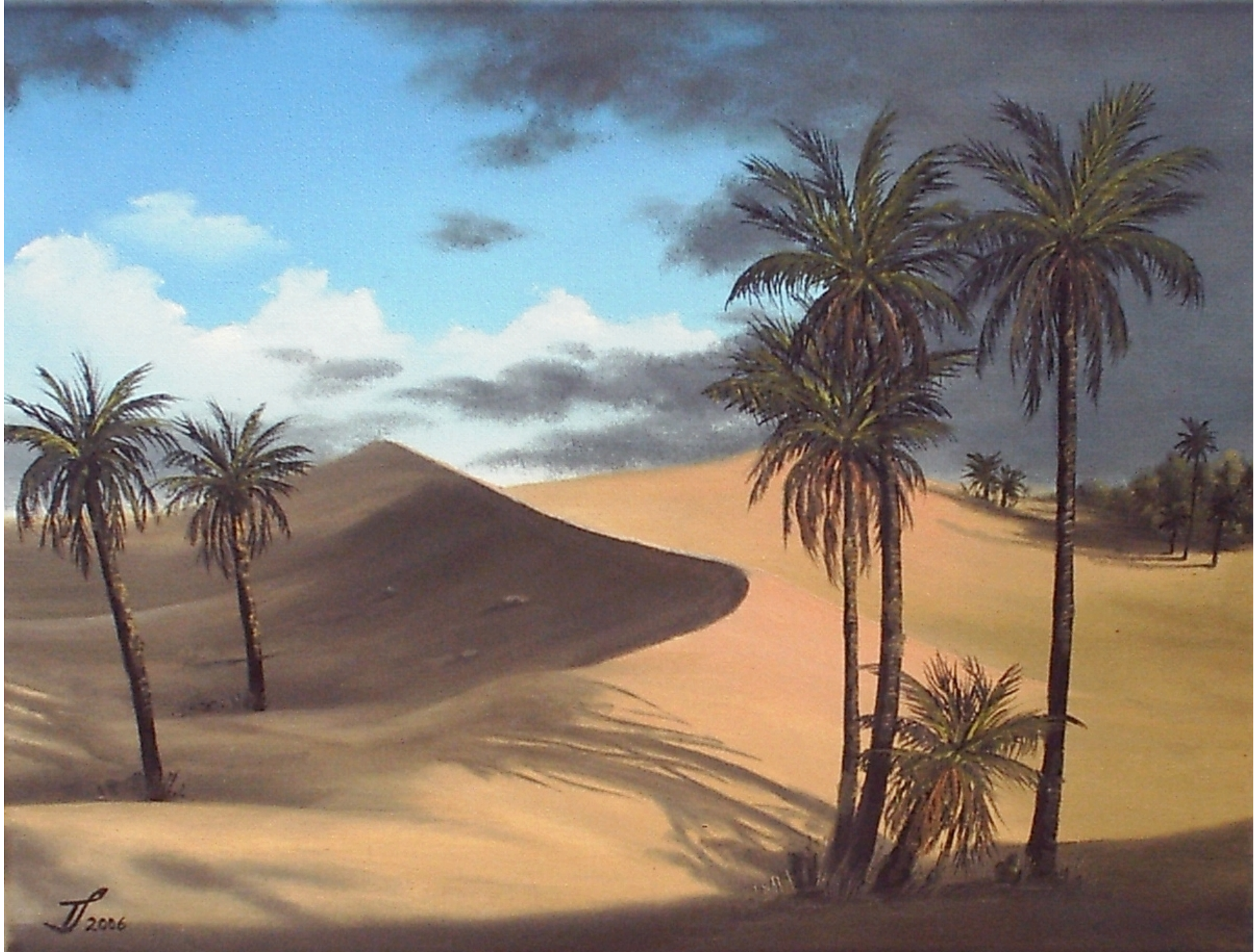
AM RANDE DER OASE